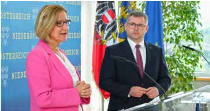
Landeshauptfrau Johanna Mikl-Leitner und Finanz-Landesrat Ludwig Schleritzko informierten zum „NÖ Landes-Investitionspaket 2020“.